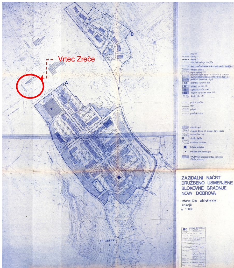
Slika 3: izsek iz ureditvene situacije ZN družbeno usmerjene blokovne gradnje »Nova Dobrava« Zreče (Ur. l. SRS, št. 6/90, Ur. l. RS, št. 25/91, 54/93, 56/98, 100/03, 69/04-popr., 53/08, 81/12, UGSO št. 12/15-teh.popr.)