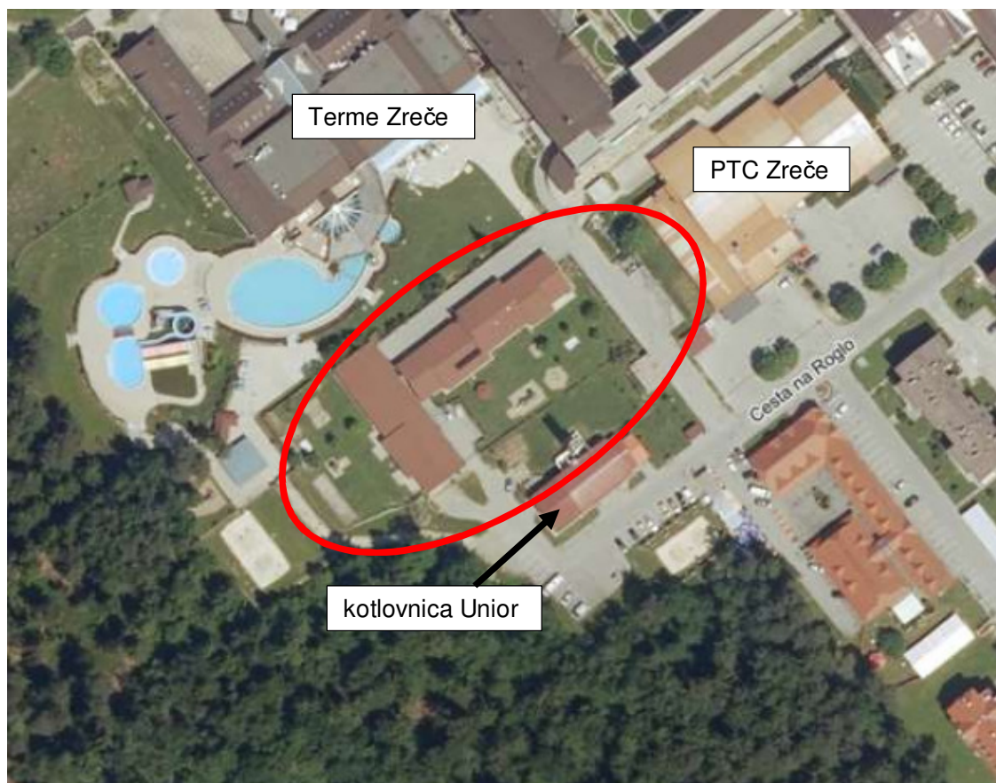
Slika 1: letalski posnetek območja