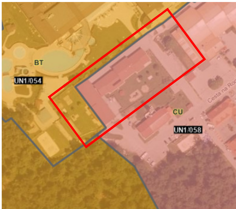
Slika 2: izsek iz karte namenske rabe prostora in enot urejanja prostora OPN občine Zreče

V Občinskem prostorskem načrtu občine Zreče je območje OPPN po namenski rabi opredeljeno kot osrednje območje centralnih dejavnosti (CU) in manjši del kot območje namenjeno površinam za turizem (BT), kar je razvidno iz spodnjega prikaza.